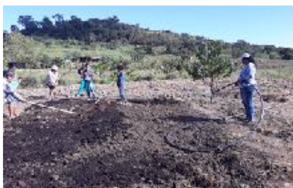
Collectifs de femmes sans-terre au Brésil